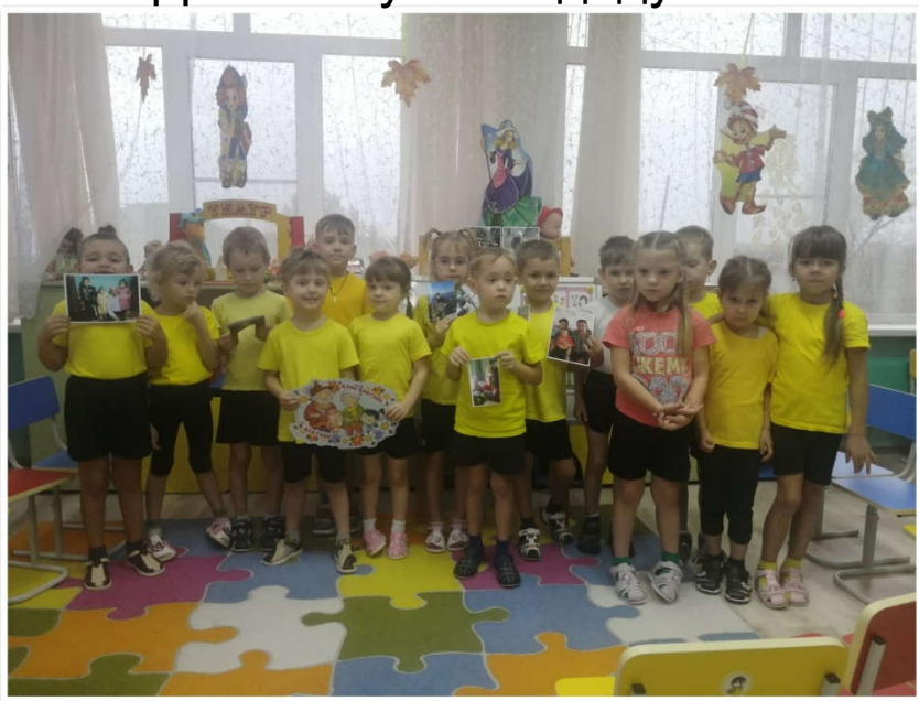
Совместное родительское собрание