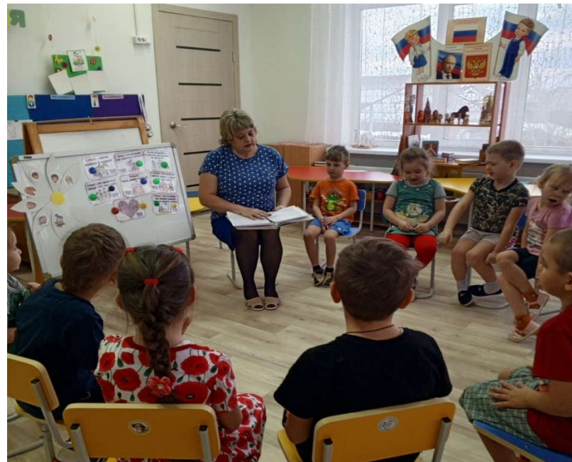
Участие в итоговом мероприятии акции