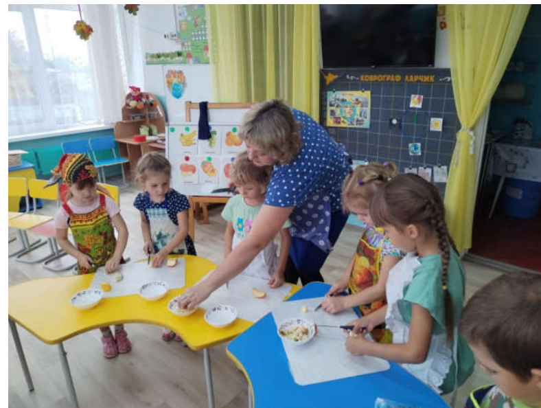
Знакомство с профессией повара, формирование семейных ценностей