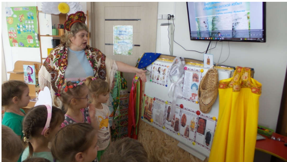
Образовательное событие «Предметы русского быта», с организацией мини музея